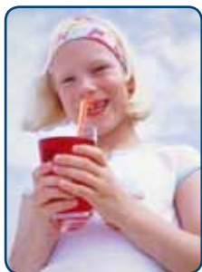
Er worden vaker en meer fris- en sportdranken gedronken

Alle kinderen zijn er gek op: snoep en frisdrank. Alle ouders weten wel dat je van snoepen gaatjes krijgt. Er zit namelijk veel suiker in. Veel minder ouders weten dat in veel zoete producten ook zuren zijn verwerkt. Je proeft ze niet, want de zoete smaak overheerst. Maar die toegevoegde zuren in voeding en dranken veroorzaken wel een ander probleem voor het kindergebit: tanderosie. Het tandglazuur van de nieuwe blijvende tanden van uw kind is nog niet volledig uitgehard. Daarom is het kindergebit extra kwetsbaar voor zuren.